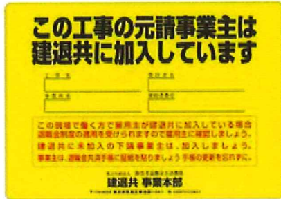
A 3 (大)

(2) 現場標識は、建退共制度の周知と意識の向上を図るためのものですから、必ずしも公共工事の現場に限られるものではありません。民間工事の現場にも掲示してください。