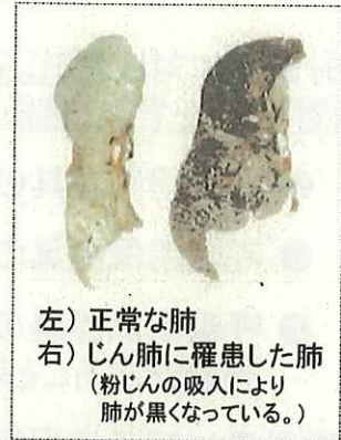
左) 正常な肺 右) じん肺に罹患した肺 (粉じんの吸入により肺が黒くなっている。)

現在、じん肺を治す根本的な治療がないため、じん肺にかからないための措置として、粉じんの発生源対策、局所排気装置等の適正な稼働、呼吸用保護具の適正な着用などにより、粉じんへの「ばく露防止対策」を徹底することが重要です。