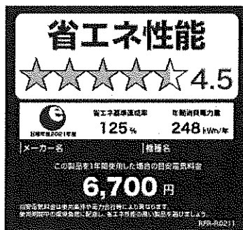
(冷蔵庫のイメージ)